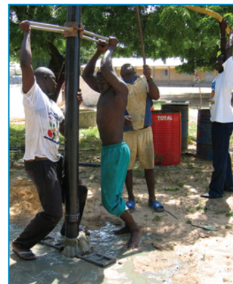
Fonçage au jet d'eau

du dragage à boue, le jet d'eau est propulsé vers le bas du tube de forage, et les débris sont propulsés vers la surface du sol, entre les parois du trou et le tube de forage. Une motopompe est utilisée afin de garantir un débit d'eau adapté. A leur extrémité, les tubes de forage peuvent être équipés de