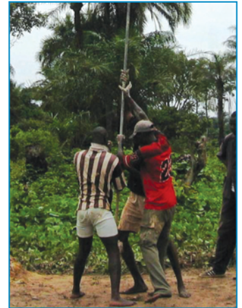
La tarière manuelle

Généralement, au dessus de la nappe phréatique, le trou de forage reste ouvert, sans soutient particulier. Au delà de la nappe phréatique, un tubage temporaire en PVC peut être nécessaire afin d'éviter tout effondrement, et pourra être vidé soit avec une tarière soit avec un écope. Ensuite le tubage permanent remplacera le temporaire. La tarière peut être utilisée pour des profondeurs de 15 à 25 mètres, en fonction des conditions géologiques.