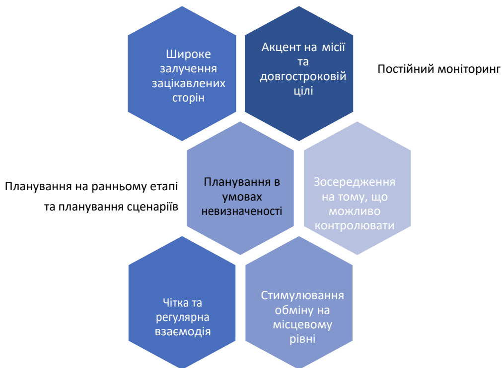
Рис. 1. ПРИНЦИПИ ПЛАНУВАННЯ В УМОВАХ НЕВИЗНАЧЕНОСТІ

Прозора комунікація навколо процесу планування, реальне забезпечення можливостей для залучення громад , а також чітка та регулярна взаємодія відіграватимуть вирішальну роль у запевненні сімей у тому, що школи готові до повернення дітей, освітян — у тому, що їхні проблеми розуміють і що їм буде надано підтримку в їх розв'язанні, а дітей — у тому, що надання освітніх послуг та методики шкільної освіти буде трансформовано, щоб підтримати їхнє навчання. Постійний моніторинг , зокрема моніторинг сприйняття запропонованих заходів та їх реалізації учнями, вчителями, батьками та освітянською спільнотою, сприятиме створенню циклів зворотного зв'язку між «користувачами» та директивними органами, а також дасть змогу здійснювати коригування та надавати відповідну інформацію для розв'язання проблем зацікавлених сторін.