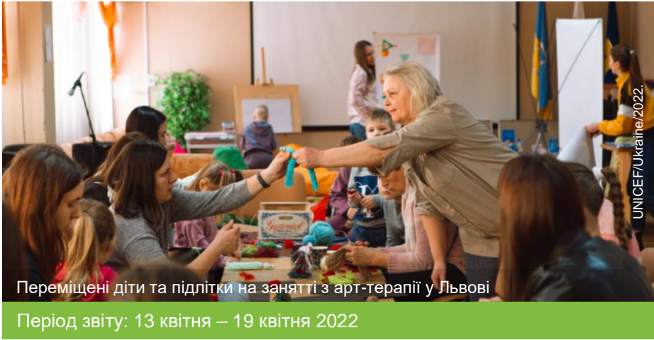
Переміщені діти та підлітки на занятті з арт-терапії у Львові

Період звіту: 13 квітня – 19 квітня 2022