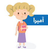
دانش آموز دختر دوره ابتدایی. از پیش دبستانی تا کلاس 8 ماهیهانه 60 لیره ترک