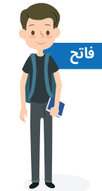
دانش آموز پسر دوره دبیرستان. کلاس 9 الی 12 ماهیهانه 70 لیره ترک