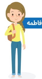
دانش آموز دختر دوره دبیرستان. کلاس 9 الی 12 ماهیهانه 90 لیره ترک