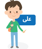
دانش آموز پسر دوره ابتدایی. از پیش دبستانی تا کلاس 8 ماهیهانه 55 لیره ترک

✓ مقدار پرداخت ماهیهانه با توجه به میزان حاضر بودن در مدرسه در ماه های گذشته متغیر می باشد. تنها برای ماه هایی که کودکان به صورت منظم به مدرسه رفته باشند کمک پرداخت می گردد.