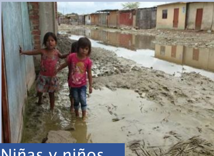
Niñas y niños

↳ Las interrupciones de servicios provocan pérdidas de desarrollo cognitivo en niñas y niños.