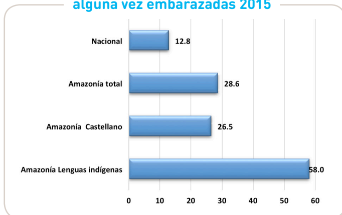
Porcentaje de adolescentes de 15 a 19 años alguna vez embarazadas 2015

no ocurre en las comunidades amazónicas -especialmente las indígenas rurales- donde esta situación no es percibida como un problema. Tampoco ocurre cuando de manera frecuente, se da como consecuencia de uniones por conveniencia entre adolescentes y hombres mayores.