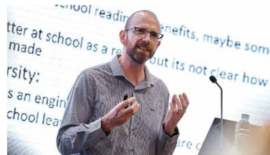
Govor dr Krisa Dezmonda, direktora Centra za studije oslobođenja, koji je glavni istraživač i viši ekonomista DST-NRF – Centra izvrsnosti za ljudski razvoj pri Univerzitetu Vits u Južnoj Africi.

Teško je – ako ne i nemoguće – nadoknaditi ono što je propušteno u ranim godinama života. Prema preliminarnom istraživanju, dodatna ulaganja u iznosu od 7,7 miliona eura – koliko je neophodno za pomenuti ciljani paket, prema procjeni ISSP-a – vodila bi potencijalnom povratu od 46,9 miliona eura. Ako bi Crna Gora potrošila dodatnih 0,6% BDP-a na rani razvoj djeteta, kako bi dostigla referentnu vrijednost od 2% BDP-a (kao što G-20 grupa zemalja preporučuje za zemlje sa srednjim dohotkom), to bi rezultiralo povratom na ulaganja u iznosu od 3,6% BDP-a. Najveća ulaganja u rani razvoj djeteta vrše same porodice, te bi vlade trebalo da osnaže porodice kako bi one bile podrška svojoj djeci. Privatno-javna partnerstva predstavljaju još jednu mogućnost finansiranja koju bi trebalo dodatno istražiti.