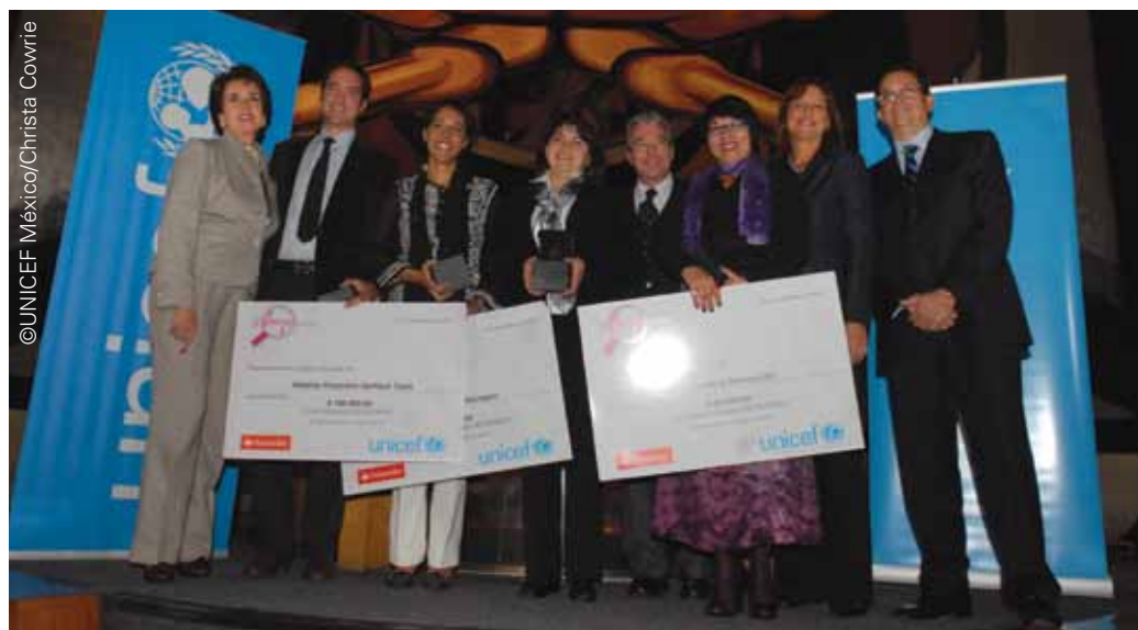
Ganadores categoría Mejor Investigación

En coordinación con la Red por los Derechos de la Infancia (REDIM) y la Junta de Asistencia Privada del Distrito Federal (JAPDF) se realizó el foro “Derechos de la infancia y la adolescencia en México: construyendo buenas prácticas” con el objetivo de promover el intercambio de conocimiento sobre experiencias exitosas tanto en el país como en la región. El foro se enmarcó bajo la convocatoria del Segundo Premio UNICEF 2009 y contó con la participación de alrededor de 150 organizaciones de la sociedad civil, incluyendo como ponentes a los ganadores de la categoría de Mejores Prácticas de la primera edición del Premio UNICEF.