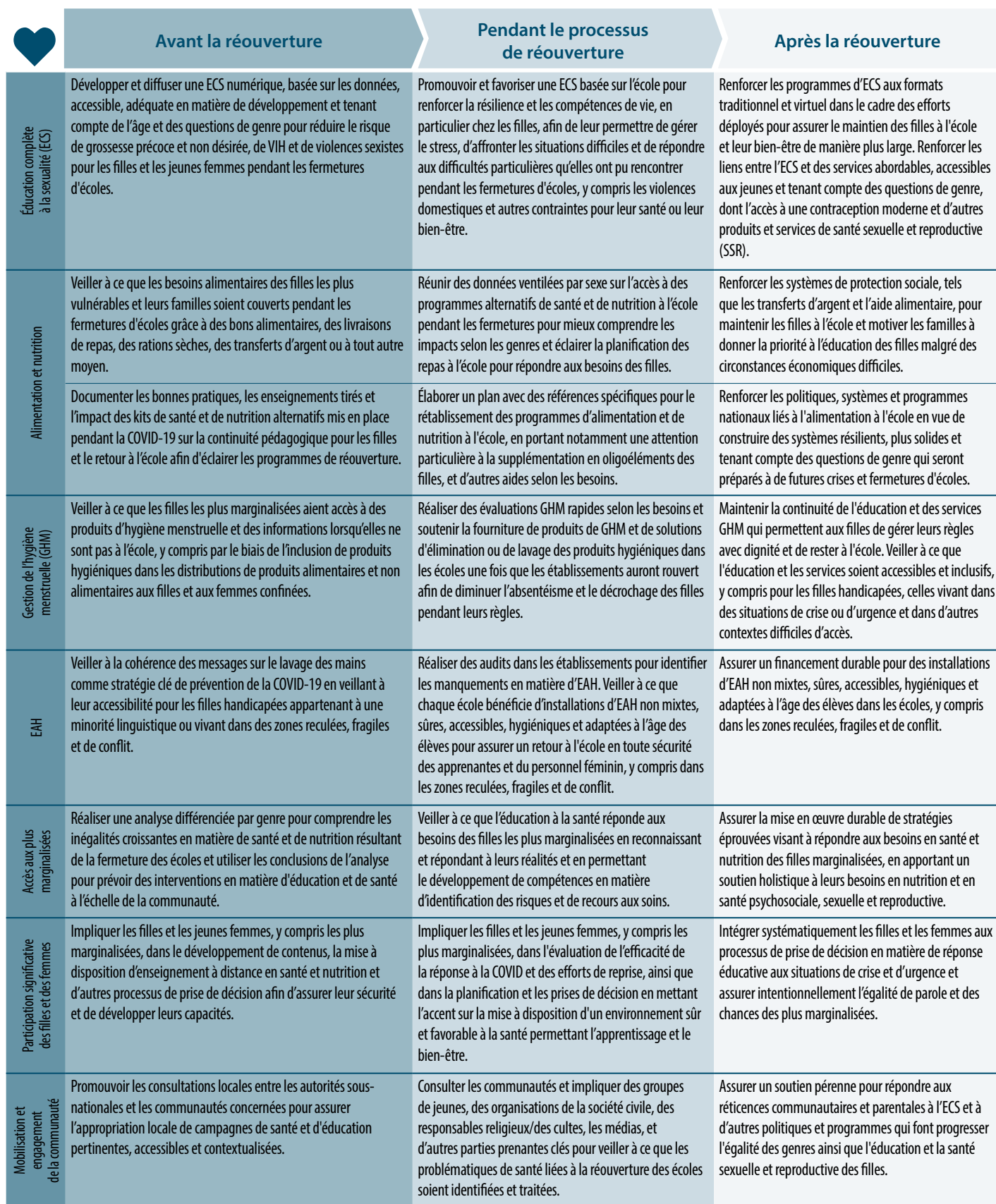
Tableau 2. Actions recommandées pour soutenir la santé, la nutrition et l'EAH