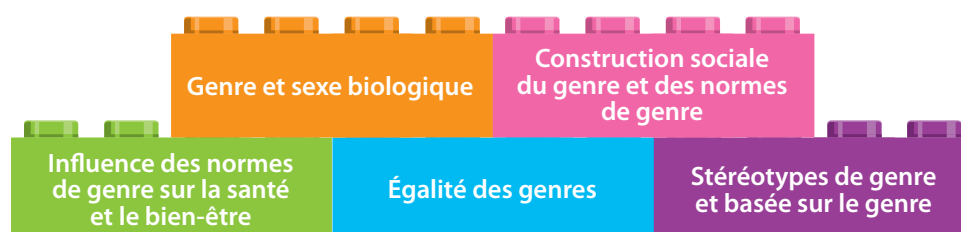
Figure 4. Sujets particulièrement importants pour les élèves en âge d'aller à l'école primaire afin de mieux comprendre les questions de genre