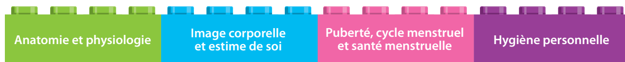
Figure 7. Sujets particulièrement importants pour les élèves en âge d'aller à l'école primaire afin de comprendre le corps humain et son développement