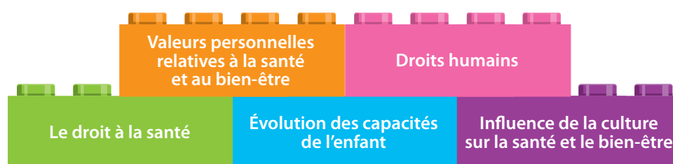
Figure 6. Sujets particulièrement importants pour les élèves en âge d'aller à l'école primaire afin de les sensibiliser aux valeurs, aux droits et à la culture