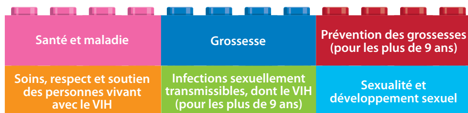
Figure 8. Sujets particulièrement importants pour les élèves en âge d'aller à l'école primaire afin de comprendre la santé et le développement sexuels et reproductifs