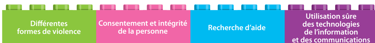
Figure 5. Sujets particulièrement importants pour les élèves en âge d'aller à l'école primaire afin de les aider à prévenir la violence et à rester en sécurité