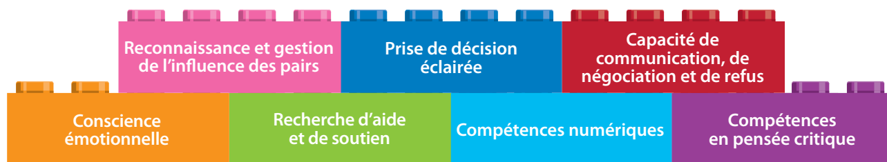
Figure 2. Compétences transversales particulièrement importantes pour les élèves en âge d'aller à l'école primaire afin de garantir leur santé et leur bien-être