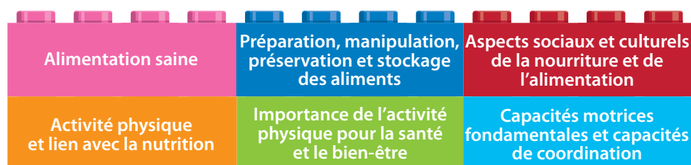
Figure 10. Sujets particulièrement importants pour les élèves en âge d'aller à l'école primaire pour se sensibiliser à la nutrition et à l'activité physique