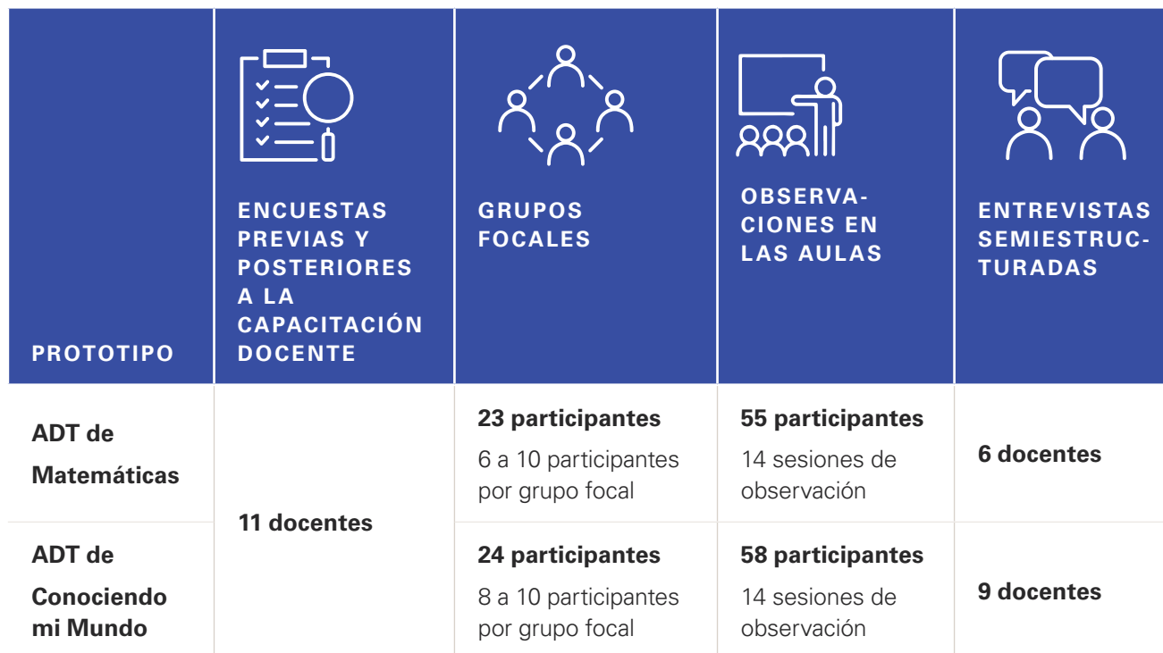
Tabla 1 : Resumen de participantes por tipo de instrumentos