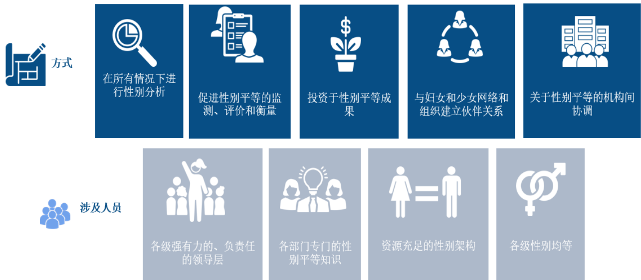
图 3 儿基会性别平等行动计划的体制推动因素

56. 在努力实现一个更加性别平等的世界这一愿景时，儿基会致力于实施性别平等方案编制战略，以实现变革性成果，并致力于在各级内部政策、做法和问责机制中实施组织变革战略，以实现性别平等。促进性别平等和结束一切形式的歧视——包括在自身的工作文化中——必须是儿基会每个人的责任，无论其角色、头衔或职位如何。因此，儿基会将使其在建设性别平等能力方面的投资与对资源配置和问责制的承诺相匹配，并将不只是实施跟踪成果的过程措施，还要支持营造有利的环境和包容性文化，使儿基会能够以身作则。