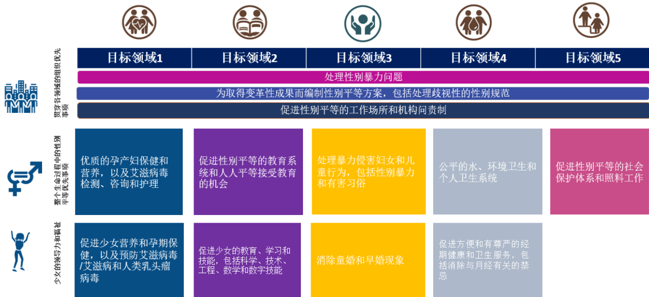
图 2 2022-2025 年性别平等行动计划：方案优先事项