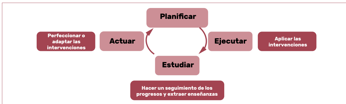
Figura 3. Panorámica de los cuatro pasos para la mejora de la calidad