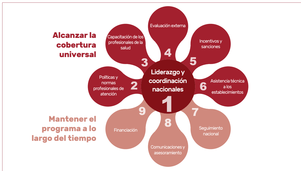
Figura 4. Cometidos clave del programa nacional de la Iniciativa Hospital Amigo del Niño