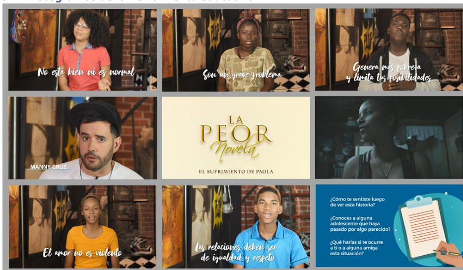
Imagen 1. Fotogramas de la herramienta educativa

El video educativo presenta mensajes claves a través de adolescentes e influenciadores que llaman a la reflexión sobre la situación y las consecuencias del MIUT. Los mensajes son presentados al inicio del video, luego de los cuales se presenta la historia de Paola (una adolescente unida siendo adolescente). Al finalizar, el video invita a las y los adolescentes a una reflexión individual y colectiva sobre la historia presentada y los mensajes compartidos en el video.