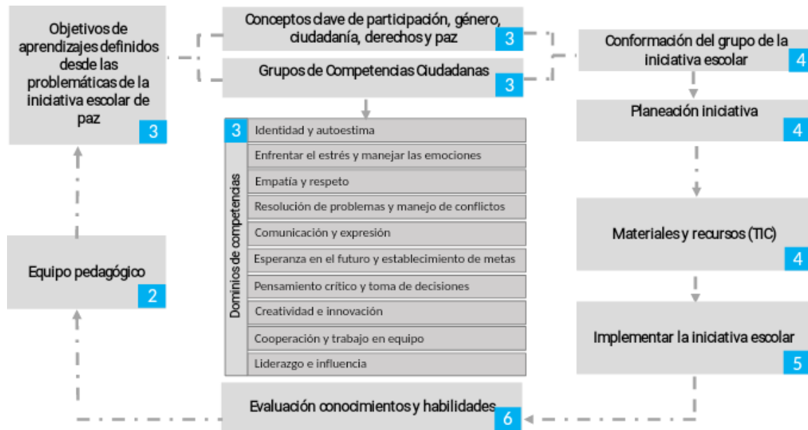
Esquema para la formular e implementa las iniciativas escolares de paz: Figura 3.

COMPONENTES DE ESCUELAS EN PAZ. Cada uno de los componentes cuenta con herramientas y actividades prácticas para su desarrollo e involucra acciones pedagógicas sencillas para vincular a las familias en las iniciativas escolares de paz.