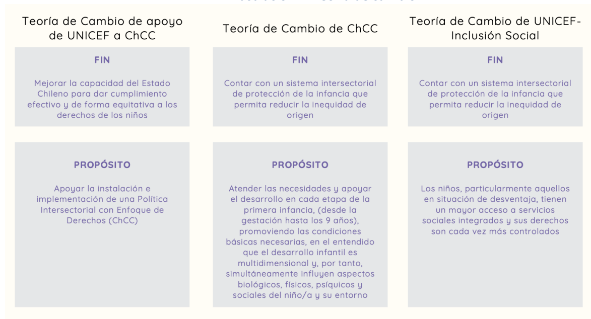
Ilustración 4: Teoría de cambio