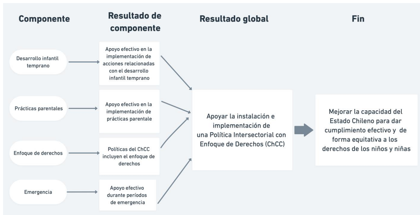
Ilustración 2: Teoría de cambio