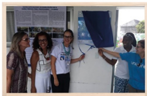
Inauguração do Centro de Treinamento nas Obras Sociais Irmã Dulce (OSID), em Salvador (BA)

A demanda por capacitações de professores para a inclusão de crianças com deficiência nas escolas é tão alta que a OSID, junto com o UNICEF e outros parceiros, já está planejando uma versão online para o curso, a fim de alcançar professores de todo o Brasil.