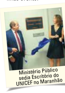
Ministério Público sedia Escritório do UNICEF no Maranhão

OG em parceria com o UNICEF. Os recursos arrecadados serão destinados ao UNICEF no Maranhão para ações de combate à mortalidade materna infantil. Mais de 5 mil pessoas estiveram presentes. Foi um lindo evento!