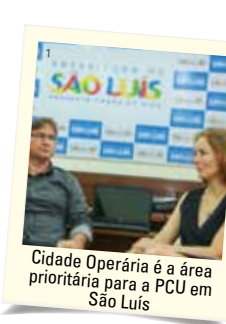
Cidade Operária é a área prioritária para a PCU em São Luís