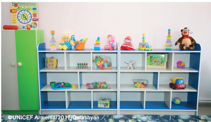
3-6 տարեկան երեխաների կրթական ծառայությունների կազմակերպումն այլընտրանքային մոդելներով

Ավազի և ջրի սեղանը կարելի է ստեղծել սեփական ուժերով: Դա կարող է լինել մեջտեղում հատուկ կտրված սեղան, որի մեջ կտեղադրվի ավազի կամ ջրի համար նախատեսված ամանը: Եթե խմբասենյակի տարածքը փոքր է, կարելի է ունենալ առանձին տարաներ ավազի և ջրի համար, որոնք խաղի ժամանակ կդրվեն սեղաններին: Ամանը պետք է լցված լինի ավազի կամ ջրի բավարար քանակությամբ, որպեսզի հնարավոր լինի ապահովել խաղային գործունեության բազմազանությունը: 3-4 տարեկան երեխաների համար ջրի մակարդակը պետք է բավականին ցածր լինի: 4-6 տարեկան երեխաների դեպքում ջրի խորությունը կարող է հասնել 8-10 սմ, որպեսզի նրանք կարողանան ավելի բարդ խաղերով զբաղվել: Ավազը պետք է ավելի խորը լինի, որպեսզի երեխաները կարողանան փոսեր փորել, կաղապարներ օգտագործել և այլն, սակայն ոչ այնքան, որ աշխատանքի ընթացքում այն թափփվի: Ավազը պետք է լինի մաքուր և լավ մաղված: