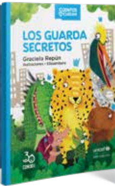
LOS GUARDA SECRETOS Graciela Repún Ilustrado por Elissambura