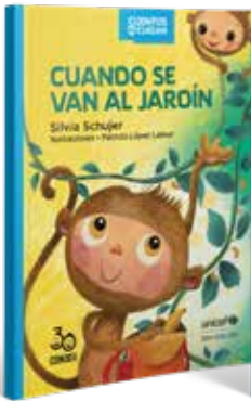
CUANDO SE VAN AL JARDÍN Silvia Schujer Ilustrado por Patricia López Latour