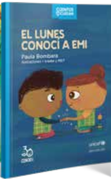
EL LUNES CONOCÍ A EMI Paula Bombara Ilustrado por Ivanke y MEY