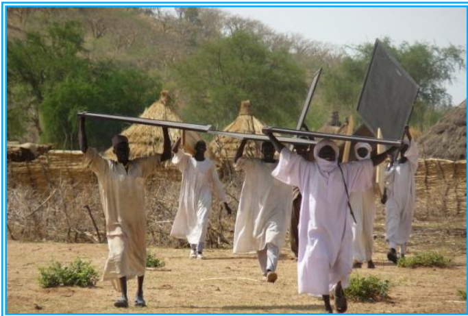
Des tableaux noirs pour les maîtres. © Fabien Lapouge, 2009.

Pour ces enfants - et leurs maîtres - UNICEF a donc poursuivi les distributions de matériel scolaire, dont une centaine de tableaux noirs et 50 nattes pour les écoles des camps de réfugiés de Djabal et de Goz Amir. L'UNICEF a également appuyés les parents dans les sites de déplacés dans leurs efforts pour réhabiliter les infrastructures du préscolaire. En même temps, 50 bâches ont été distribuées pour la maintenance et la réhabilitation des toits des écoles des différents sites.