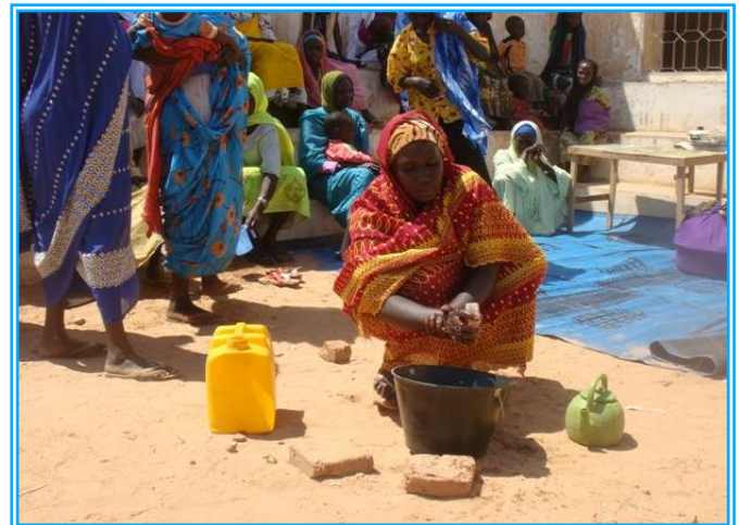
Démonstration de lavage des mains au savon par les groupes de femmes de Goz Beida, lors de la journée internationale du lavage des mains le 15 octobre.

Au delà de la zone d'Adé, dans tous les autres districts d'action humanitaire les partenaires du Cluster WASH ont maintenu en novembre leurs efforts de promotion à l'hygiène, dont notamment la distribution de savons. Au total 58,831 barres de savons ont été distribuées en novembre à Goz Beida ainsi que dans la zone de Kerfi avec l'aide de World Concern. A Koukou entretemps c'est Intermon Oxfam qui a organisé la réception de 76,000 savons pour les distributions présentes et à venir dans les sites d'Aradib, Habilé et le camp de réfugiés soudanais de Goz Amir. Chaque distribution est usuellement accompagnée d'effort de sensibilisation des communautés aux bonnes pratiques d'hygiène. Au total, les activités d'UNICEF et des partenaires au sein du Cluster WASH contribuent à améliorer les conditions de vie d'environ 60,000 personnes déplacées.