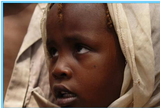
Une jeune fille à Goz Beida.

Cinquante-deux enfants réfugiés et déplacés ont été nouvellement admis dans les centres de supplémentation nutritionnels lors des trois premières semaines de novembre, tandis que 22 ont été admis dans les centres ambulatoires et 8 enfants parmi les plus sévèrement malnutris ont été admis dans le Centre Nutritionnel Thérapeutique. Ces chiffres représentent une baisse comparée au mois d'octobre, confirmée par ailleurs par un exercice de screening nutritionnel montrant une légère baisse de la malnutrition aigue globale (MAG). Cette baisse doit cependant être nuancée par les mouvements constants de population - le screening n'ayant ainsi pu couvrir que 66% de la population cible pour cette raison. A noter également que les moyens manquent pour assurer une surveillance et un dépistage actif dans les communautés hôtes. Les équipes d'UNICEF et des ONG partenaires - dont COOPI - continuent cependant d'œuvrer contre la malnutrition dans la zone, y compris avec le support offert aux mères: 341 femmes enceintes ou allaitantes ont ainsi reçu un appui nutritionnel ce mois à Goz Beida.