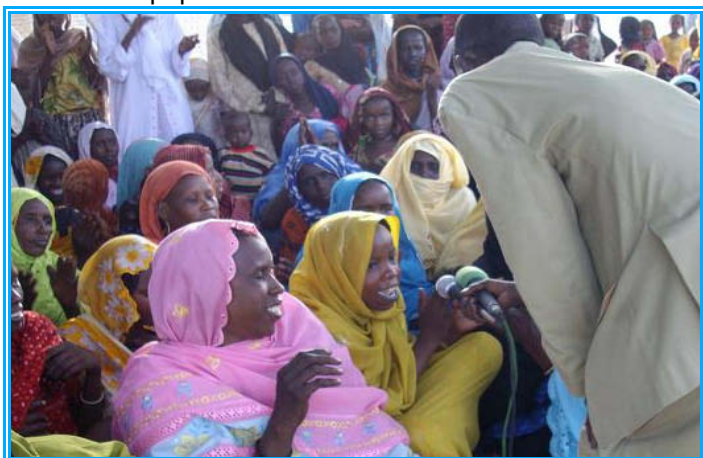
Les femmes prennent la parole en faveur de l'éducation des filles lors d'une émission de radio communautaire à Koumbagri.

Récemment, les 22-28 Juin, l'UNICEF a ainsi appuyé la formation de 10 animateurs de radio communautaire de la station locale Radio N'Djimi. L'objectif de la formation est de leur fournir les connaissances et les techniques de base afin de produire des émissions interactives avec la participation des communautés. Pour matérialiser l'apprentissage, 4 microprogrammes et 2 exercices de simulation de jeux publics ont été organisés. Dans le village de Koumbagri les communautés ont ainsi pu discuter du thème de l'éducation des filles et à Tarfé sur le lavage des mains. Le Gouverneur du Kanem, le Maire de la ville, le représentant du sultan ainsi que le délégué sanitaire ont tous pris part à cet important exercice qui a mobilisé les populations.