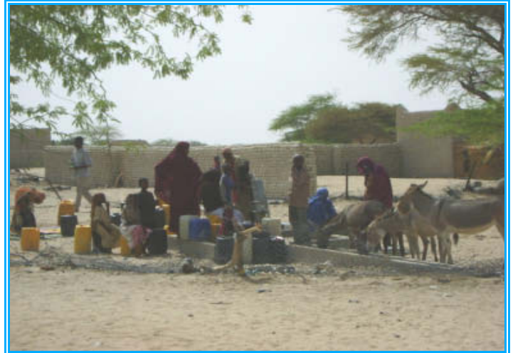
La communauté et les patients au CNA de Michemire ont à nouveau accès à l'eau potable grâce aux efforts de réhabilitation conduits par UNICEF © UNICEF/J.Ntambi, 2009.

Suite à cette évaluation des travaux de réparation et de réhabilitation ont été lancés pour garantir un accès à l'eau potable dans les CNA, à la fois pour les enfants malnutris, leurs familles, pour les travailleurs de santé dans les centres et les communautés attenantes.