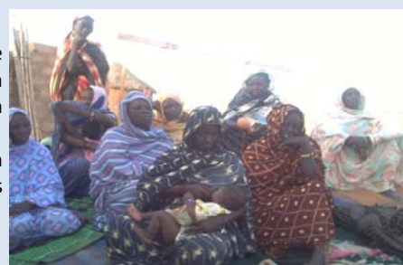
Formation des relais communautaires à Bouratt

Enfin, cette action mettra en plus en valeur 'le marketing des habitudes' en vue de promouvoir la pratique du lavage des mains. Pour cela, les ménages cibles seront équipés des kits de 'lave mains' ( makhsel ) avec du savon. Ces kits motiveront l'adoption de la pratique. La conservation de l'eau propre à domicile sera aussi encouragée en dotant les ménages de bidons en matière plastique, une pratique déjà existante.