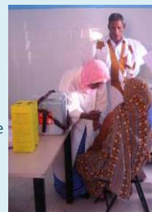
Une équipe supervise le 2 ème tour de la campagne contre le tétanos à Akjoujt