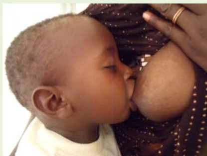
Le fils de la bénéficiaire de Bouhdida s'endort en tétant.