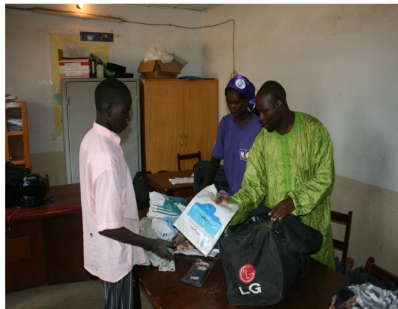
Ce jeune ex enfant soldat recevant son kit d'entrée dans le CTO.

Chaque enfant a reçu un kit d'entrée au CTO composé de : Couverture, serviette, drap, moustiquaire, pantalon Jeans, pantalon tissu, chemise, Tee-shirt, tennis, sandale, brosse à dent, Colgate, savon linge, savon toilette, sac, tapette, grand-boubou, ceinture, matelas et oreiller.