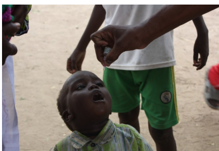
Un enfant entrain de recevoir les gouttes de polio.

Le BIEC a organisé des réunions du 23 au 30 dans les 10 arrondissements de la ville de N'Djamena des briefings et de mobilisation sociale avec 64 délégués de quartiers et 10 chefs de bureau d'arrondissement.