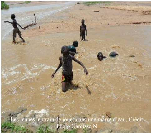
Les jeunes entrain de jouer dans une marre d'eau.

Les pluies diluviennes qui se sont abattues sur la Région de Sila ont causé des dégâts tant matériels que des pertes en vies humaines. 21 personnes, femmes et enfants arabes nomades