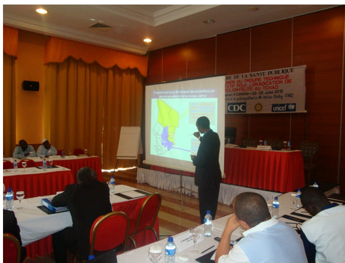
Une vue des participants à la réunion du GTC.