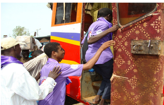
3 Départ des enfants de N'djaména vers l'Est du pays pour la réunification familiale.

Quelques jours plus tôt, soit le 11 juillet 2010, huit ex-Enfants Associés aux Forces et Groupes Armés après un séjour de plusieurs mois dans les Centres de Transit et d'Orientation de N'djaména géré par Care International ont quitté la ville en vue de leur réunification familiale dans l'Est du Tchad (Abéché, Guéréda, Adré, Molou). Ces derniers ont bénéficié durant leur séjour d'un accompagnement psycho-social. Certains de ces enfants ont pu en outre bénéficier d'un apprentissage professionnel et les autres d'une scolarisation. Un des temps forts a été l'explication des fresques murales réalisées par eux durant leur séjour dans les CTOs.