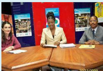
Emission sur la CDE à Canal 3 TV