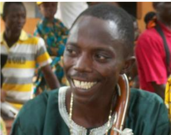
«Kandoton», vainqueur de la compétition