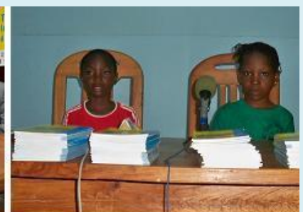
Sensibilisation sur la CDE au Stade de l'Amitié présidée par des enfants