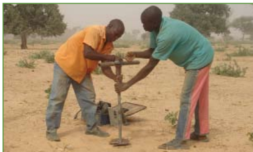
Les forages manuels