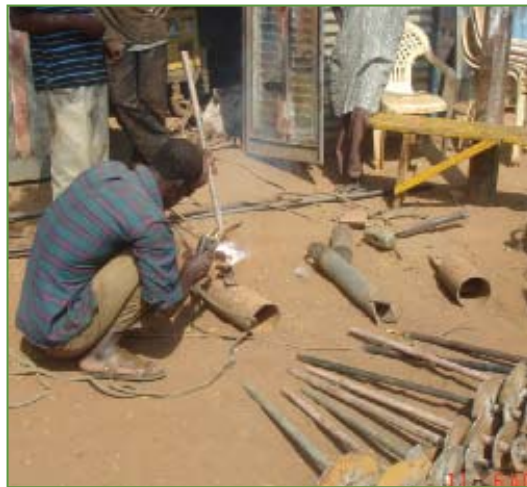
Fabrication d'équipements de forage

œuvre, afin de les atteindre. L'accent doit être mis sur des solutions qui sont accessibles, tant