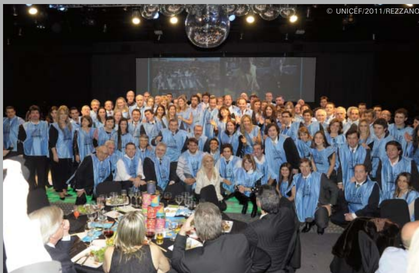
Los empresarios también se pusieron la camiseta CERO FALTA.

Participaron más de 1.200 personas de 120 empresas y además de recaudar 2,5 millones de pesos, el encuentro dejó en claro el compromiso de los empresarios con la educación de los niñas y niños de Uruguay.