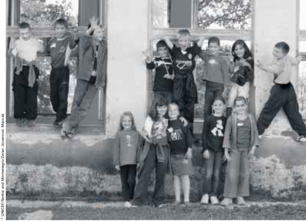
Barajevo'daki Manic köyünde eski okul binasının önünde duran çocuklar. Barajevo Belgrad'ın en yoksul belediyelerinden biridir. Resimdeki çocuklar da daha önce yapılan "Sırbistan ve Karadağ'da yoksulluk ve çocuklar" başlıklı bir grup çalışmasına katılmışlardır.