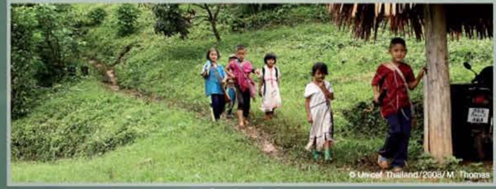
แม่โจ้จะเดินเป็นระยะทางไกลทุกเช้า แม่เด็ก ๆ ก็ยังยิ้มสดใส ยามได้มาโรงเรียน

หลังโรงเรียนเลิก เด็ก ๆ พวกเขาเดินกลับเข้าสู่ทางเดินที่ทอดตัวผ่านป่าในทิวเขากว้างใหญ่...มีงานอีกมาก ที่คอยอยู่ที่บ้าน และพวกเขาที่จะรีบเข้านอนเพื่อพรุ่งนี้จะตื่นแต่เช้า และได้กลับมาที่ "โรงเรียนชาวเขา" ของพวกเขาอีกครั้ง