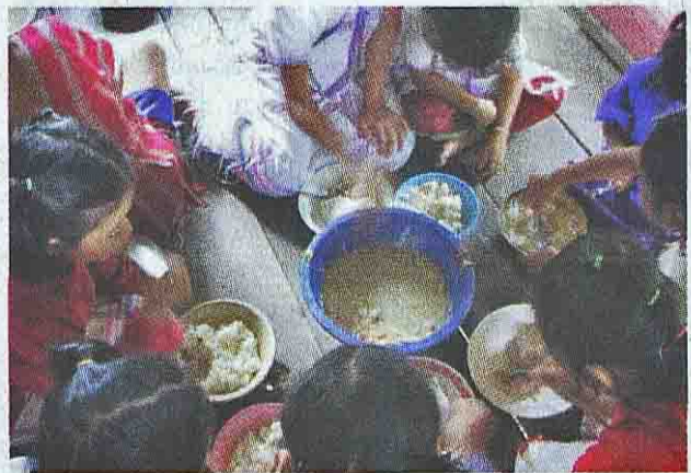
อาหารมือเที่ยงที่มีกับข้าวกะละมังใหญ่เป็นต้มข้าวไก่