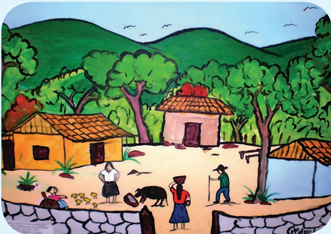
„Ежедневие у нас“, Пегро Хосе Ривера, 14 г., Никарагуа