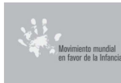
LOGO DEL MOVIMIENTO GLOBAL

Hay un consenso sobre los diez imperativos de la “convocatoria” del Movimiento, alrededor de los cuales debe movilizarse la acción a todo nivel. La convocatoria fue lanzada en Febrero del 2001 por seis organizaciones – el Comité de Progreso Rural de Bangladesh (BRAC), Plan