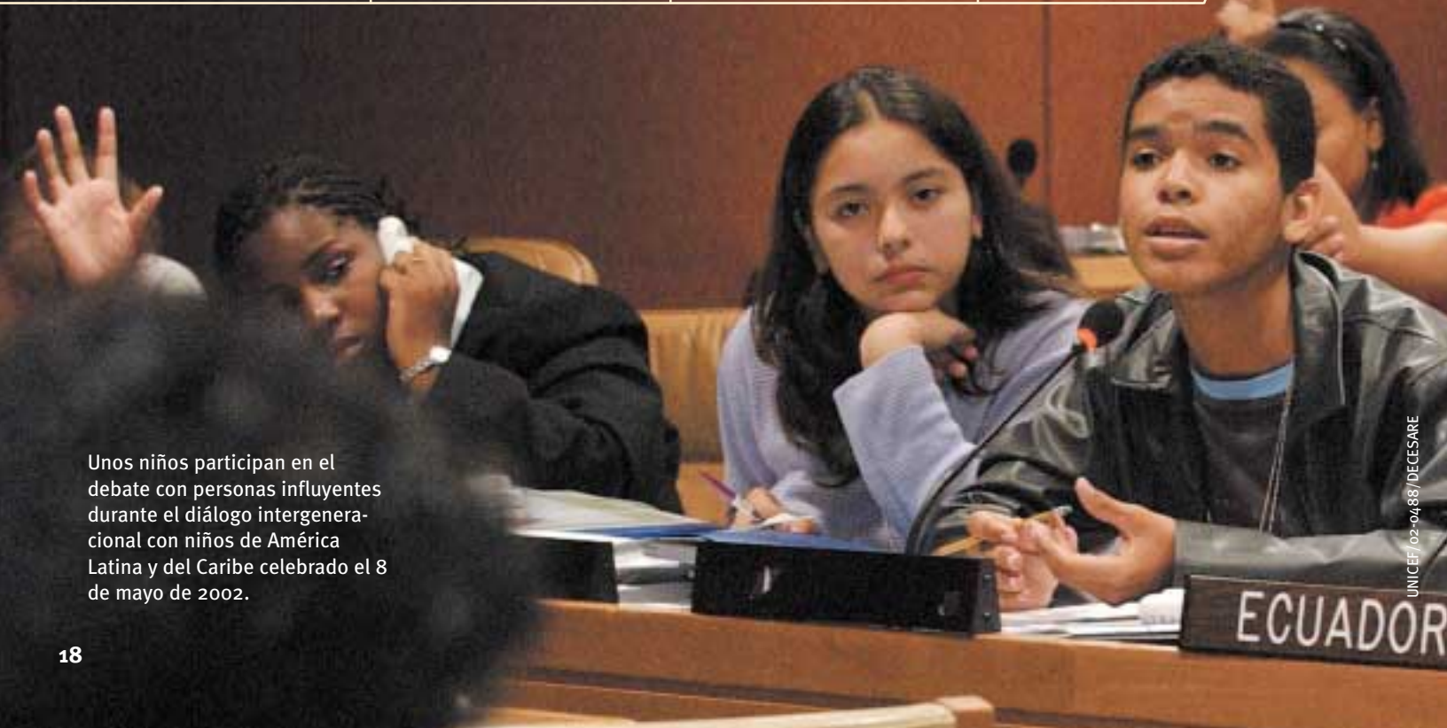
Unos niños participan en el debate con personas influyentes durante el diálogo intergeneracional con niños de América Latina y del Caribe celebrado el 8 de mayo de 2002.