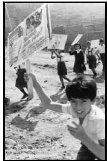
Escolares peruanos desfilan en su comunidad para anunciar el programa nacional de inmunización que comienza al día siguiente.

Todo ataque integral contra el trabajo infantil debe movilizar también una amplia gama de participantes: Gobiernos y comunidades locales, ONG y líderes espirituales, empleadores y sindicatos, los propios niños trabajadores y sus familias. Unos estarán más interesados en proteger a los niños afectados; otros en promover oportunidades educativas que ofrezcan una salida del círculo vicioso formado por el trabajo infantil y la pobreza; y otros en abogar por una mayor sensibilidad mundial sobre esta grave violación de los derechos humanos. Lo importante no es que prevalezca una es-