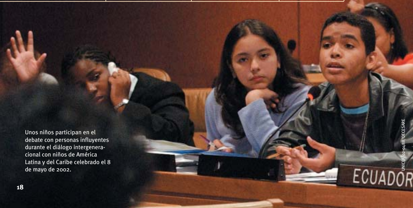
Unos niños participan en el debate con personas influyentes durante el diálogo intergeneracional con niños de América Latina y del Caribe celebrado el 8 de mayo de 2002.