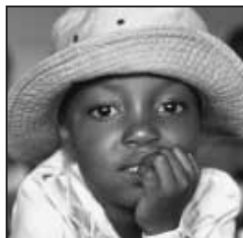
ÁFRICA AL SUR DEL SAHARA

La relación deuda-PNB es uno de los diversos indicadores que se emplean para medir la deuda. La relación entre el servicio de la deuda y las exportaciones también determina si las deudas de los países pobres tienen “carácter sostenible”, al igual que las condiciones bajo las que se solicitan los préstamos. Casi tres cuartas partes de la deuda en que incurrió Guinea-Bissau, por ejemplo, se rigen por condiciones favorables (a largo plazo con bajas tasas de interés y reembolsos diferidos), mientras que Turkmenistán tomó menos de un 5% de los fondos en préstamo en tales condiciones. Sin embargo, la elevada relación deuda-PNB de Guinea-Bissau es síntoma de graves tensiones económicas y sociales.