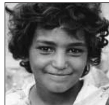
ORIENTE MEDIO Y ÁFRICA SEPTENT.