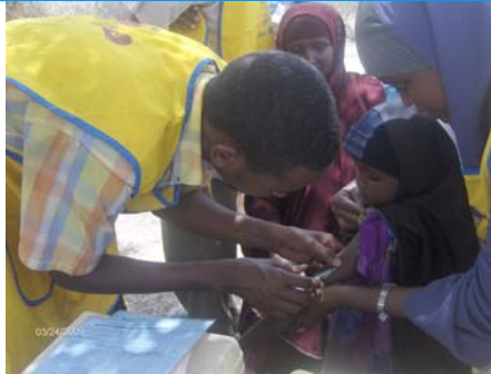
Gabar la tallaalayo waqtigii Ololihii Maalmaha Caafimaadka Carruurta ee Soomaaliya.

Barnaamijka wadajirka ah ee UNICEF iyo WHO ee Dardargelinta Badbaadada Carruurta Yaryar ee Soomaaliya ee sanadaha 2008-09, ayaa ka dhigan bilowga dadaalka noocaas ah. Waxaa uu ku fadhayaa xaqiiqo caalami ah oo sayniska lagu ogaaday iyo waayo-aragnimo laga heley sanado badan oo