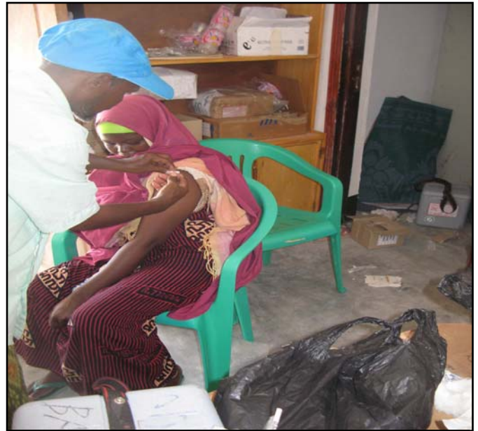
Haweeney laga tallaalayo teetanada intii uu socdey ololaha Maalmaha Caafimaadka Carruurta ee Soomaaliya.

Waxqabadyada carruurta ayaa ay si wanaagsan u arkeen bulshooyinka, qoysaska iyo shaqaalaha caafimaadka. Maamullada iyo sidoo kale bulshooyinka ayaa ku farxay in ay arkaan waxqabad dhab oo la taaban karo oo ay helaan dadkooda. Shaqaalaha caafimaadka ayaa ay dhiirgeliyeen hawlaha dardarta ku socda iyo faa'iidada sarreeya ee lagu gaarey dadaalkooda waxaana jirta in dadweynuhu ay si cad u soo dhoweeyeen bixinta adeegyada aasaasiga ah ee lacag la'aanta ah, taas