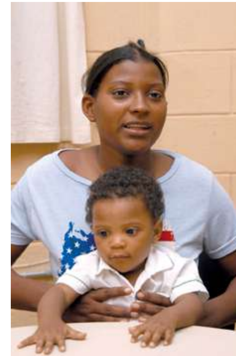
Anyi, joven madre participante en el proyecto