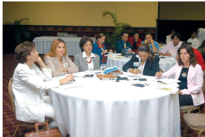
Representantes de organizaciones en los municipios participantes en la evaluación