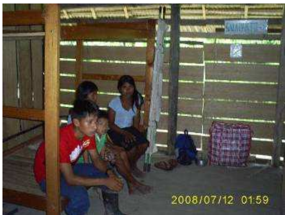
Esposo y familia esperando el parto