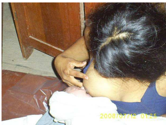
Madre tiene primer contacto con recién nacido.