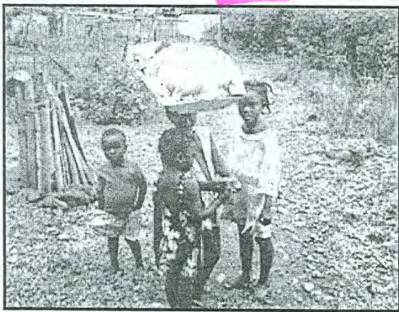
Terá lugar em breve o levantamento estatístico sobre o trabalho infantil em Moçambique

Na capacitação, que decorre até o dia 25 do mês em curso, participam 30 quadros de planificação e estatística do trabalho, afectos às direcções provinciais dos Institutos Nacionais de Segurança Social e do Emprego e Formação Profissional. O curso conta com a participação de representantes da Embaixada de Portugal e do UNICEF, em Moçambique.