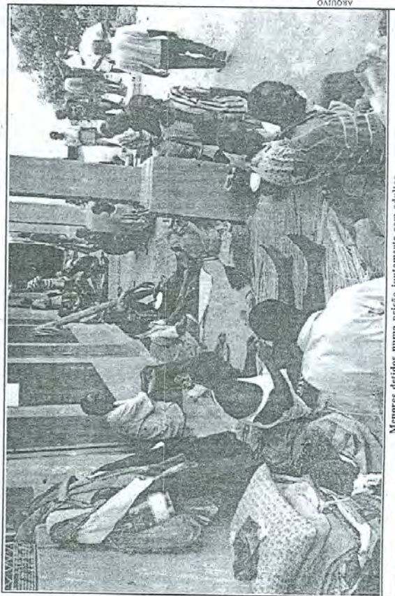
Menores detidos numa prisão juntamente com adultos

UM total de 7012 crianças encontravam-se detidas ilegalmente nas cadeias do país até 2002, depois de no ano anterior terem sido identificadas 1355 na mesma situação. Estes dados foram revelados ontem por Lurdes Mabunda, do Ministério do Interior, citando uma pesquisa realizada pela Save the Children Norway, sem no entanto, apontar as condições em que as referidas crianças se encontram aprisionadas. De acordo com a nossa fonte, porque pouco ou quase nada foi feito para inverter o cenário, as cadeias do país poderão estar actualmente com mais de 10 mil