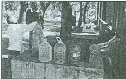
Crianças envolvidas no negócio de água no cemitério

Segundo um comunicado de imprensa daquele ministério, 1 de Junho é o dia da criança africana (16 de Junho) realizam-se, este ano, sob o lema: "Combatendo o tráfico, o abuso e a exploração de criança, preservamos seus direitos".