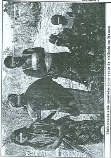
Mulheres-da-vida apontadas como causa da violência em Mavuco

durante o dia estas mulheres andam de lado para outro a fazer contactos e recolher dinheiro dos potenciais parceiros sexuais, na perspectiva de satisfazê-los logo à noite. Regra geral, elas não têm tido capacidade humana para cumprir todos os seus compromissos sexuais, o que muitas vezes culmina em zanganas, com os clientes a exigir a repuição do dinheiro ou sexo. A armação tem terminado em desgraça para a aldeia. É que