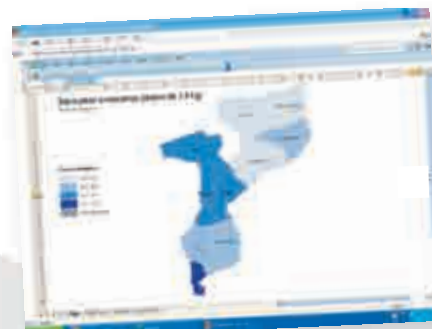
Crie mapas ilustrando áreas geográficas