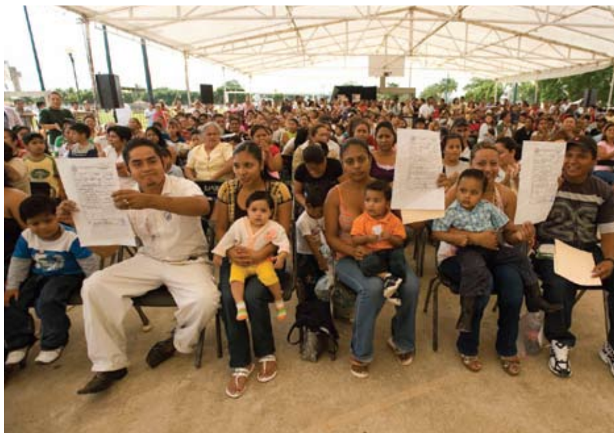
Ceremonia de expedición y reposición de actas de nacimiento en Tabasco.

Para responder a esta situación, se celebró un convenio con la Dirección de Registro Civil de Tabasco para adquirir y habilitar una Unidad de Registro Móvil. Su propósito es ir directamente a las comunidades a ofrecer el servicio de reposición de actas de nacimiento de manera gratuita, así como la expedición de actas para personas que no la poseen y de esta manera abatir el subregistro en el estado.