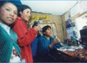
UNICEF / Premio Iberoamericano de Comunicación

En la Amazonia , Brasil está desarrollando, en 79 municipalidades de los departamentos de Amazonas, Maranhão y Pará, la "Agenda Para Los Niños de la Amazonia" que contempla acciones de Educación, Salud y Protección. Aunque en menor número, en Venezuela, UNICEF apoya en casi una decena de municipios del Estado de Amazonas, acciones de fortalecimiento a Defensorías (de los Shamani, por ejemplo) Educación Intercultural Bilingüe, Apoyo a la Participación de Jóvenes y Educación en Derechos Humanos. En Colombia, con acciones de Desarrollo infantil, Campañas contra la Explotación Sexual Infantil, el UNICEF ha dirigido parte de su cooperación hacia el departamento de Amazonas. Por último Perú, también tiene presencia en la Amazonia a través de la Vigilancia Social de las Políticas Públicas, además de apoyo a los municipios Provinciales de Luya, Chachapoyas y Condorcanqui con acciones en áreas de Salud, Educación y Protección.