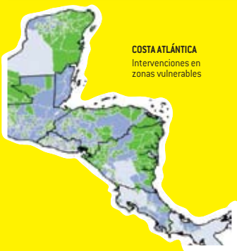
COSTA ATLÁNTICA Intervenciones en zonas vulnerables

Finalmente, dentro del Marco del Convenio de Gobernabilidad Local entre UNICEF y PNUD, y basados en datos que se han obtenido de las oficinas de país de UNICEF, sobre con quien se está trabajando en los municipios, y de Iniciativas de otras agencias como la de "Municipios Saludables" de la OPS, se harán esfuerzos por ir incorporando en esta base de datos, información de las agencias del sistema.