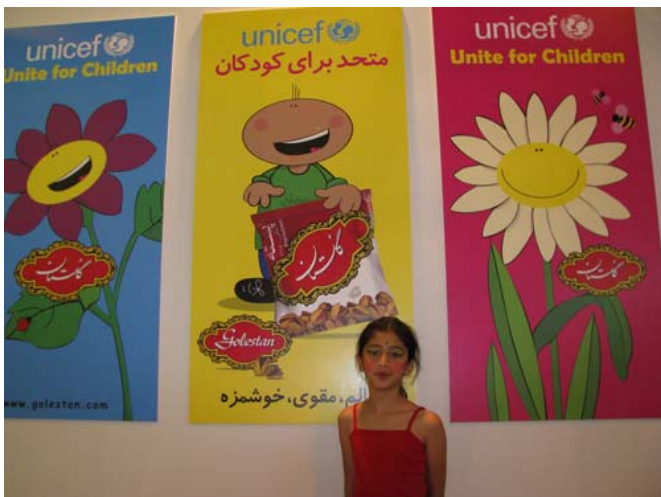
پوسترهای گلستان، بزرگترین تولیدکننده چای در ایران

چرا یونیسف باید در نمایشگاه مواد غذایی حضور داشته باشد؟ شاید این سوال به ذهن بسیاری از بازدیدکنندگان نمایشگاه بین‌المللی مواد غذایی، نوشیدنی و بسته‌بندی که سال جاری در تهران برگزار شد، رسید. البته با بازدید از غرفه تک ماکارون و گلستان، دو شرکت ایرانی تولیدکننده مواد غذایی، می‌توان جواب سوال را یافت.