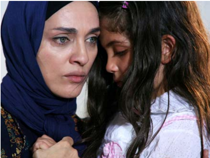
بیماری مانا مشکلات عاطفی زیادی را برای خانواده اش بوجود می آورد.

و داستانهایی که در دوران ساخت این فیلم مستند داستانی به آنها دست یافته بودم تنها ماندم. البته به عنوان یک فیلم ساز طرح های دیگری نیز در ذهن داشتم که ما حاصل آنها چند مجموعه مستند و تله فیلم گردید. ولی یکی از داستانهایی که بسیار مرا به خود مشغول ساخته بود پایه ساخت فیلم مانا شد. به همین خاطر زمانی که توسط موسسه رسانه های تصویری پیشنهاد ساخت فیلمی سینمایی در باره ایدز را دریافت کردم بی درنگ دست به کار شدم و دغدغه ها و تحقیقاتم را به صورت یک فیلمنامه سینمایی در آوردم. البته تشویق ها و راهنمایی های دوستانی که در این زمینه فعالیت می کردند نظیر دکتر زمانی، برایم بسیار موثر بود.