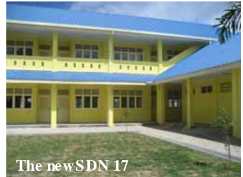
The newSDN 17

UNICEF dan Badan Rekonstruksi dan Rehabilitasi Aceh-Nias (BRR) mengambil satu langkah maju dalam hubungan kerjasamanya, dengan secara resmi menandatangani daftar yang telah direvisi tentang 346 lokasi sekolah. UNICEF telah memiliki komitmen untuk membangun sekolah yang tahan gempa dan ramah anak di 346 lokasi tersebut. Penandatanganan ini merupakan kelanjutan dari kesepakatan awal antara UNICEF dan BRR pada bulan September 2005. Sebagai bagian dari upacara yang meriah yang berlangsung di SDN 17 kecamatan Sukaraja, UNICEF juga secara simbolis