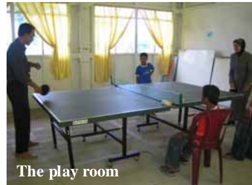
The play room

Sebanyak 346 lokasi mewakili 376 unit sekolah, yang menjadi komitmen UNICEF telah diserahkan kepada mitra pelaksana. Di samping 52 sekolah yang telah selesai dibangun, 100 lainnya dalam tahap pembangunan dan 55 dalam proses tender. Untuk mempercepat proses pembangunan, UNICEF bekerjasama dengan tiga mitra pelaksana, yaitu UNOPS (213 lokasi), Bitra (66 lokasi) dan Nippon Koei (67 lokasi)