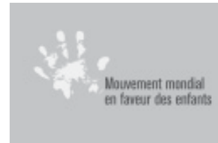
LOGO DU MOUVEMENT MONDIAL

Un consensus s'est dégagé autour des dix impératifs qui forment l'Appel à la participation au Mouvement mondial en faveur des enfants. Cet appel, lancé en février 2001 par six organisations – le Bangladesh Rural Advancement Committee (BRAC), Plan International, Save the Children Alliance, World Vision International, la Netaid.org Foundation et l'UNICEF, permettra de regrouper les initiatives prises à tous les niveaux.