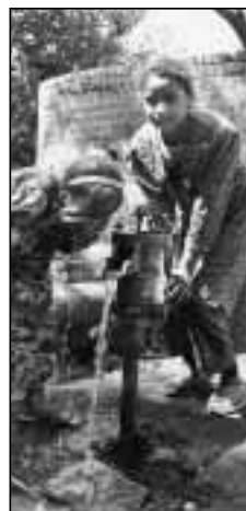
L'aide doit être axée sur les besoins essentiels. En Egypte, près d'Assiout, deux jeunes filles tirent de l'eau à une pompe à main.