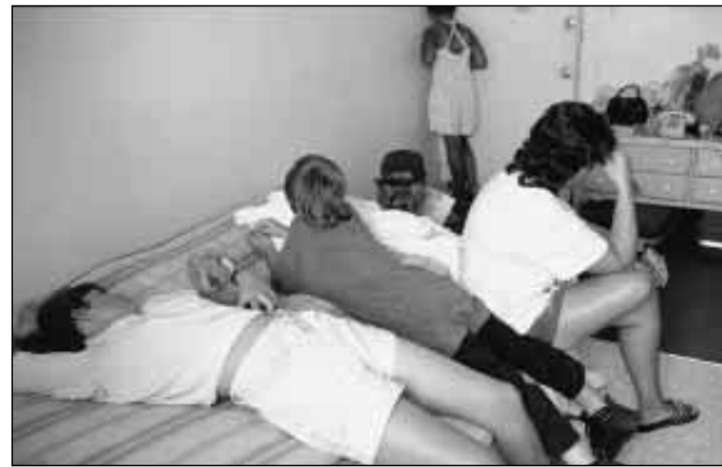
Sans foyer, il est difficile d'exercer ses droits, et même de mener une vie normale. Cette famille, de Daytona Beach (États-Unis), n'ayant pas le droit de rester plus longtemps à l'asile, a reçu un bon de séjour d'une semaine dans un motel – une seule chambre pour cinq personnes. Les enfants, âgés de 7 à 13 ans, ne sont pas scolarisés.

Dans la plus grande partie du monde industrialisé, le droit au logement n'est guère considéré que comme l'expression d'un objectif valable, mais lointain. Peut-être s'agit-il là d'un problème de perception: on pense que reconnaître ce droit signifierait