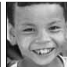
ASIE EST/SUD et PACIFIQUE