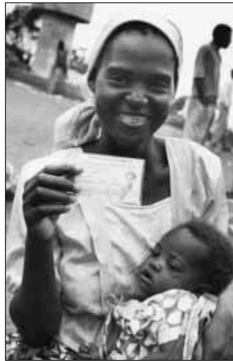
Le plus souvent, sans bulletin de naissance, pas de droit de vote. Cette Mozambicaine est fière de participer aux premières élections démocratiques de son pays, en 1994.

La réserve formulée par l'Égypte touchant l'article 9 ne tient aucun compte des difficultés auxquelles se heurtent les enfants qui deviennent des étrangers dans leur propre pays simplement parce qu'ils ont automatiquement la nationalité de leur père. Au contraire, la réserve déclare: «Il est clair que l'acquisition par l'enfant de la nationalité de son père est la procédure la plus appropriée pour l'enfant et que cela n'enfreint pas le principe de l'égalité des hommes et des femmes, puisqu'il est de coutume pour la femme qui épouse un étranger d'accepter que ses enfants aient la