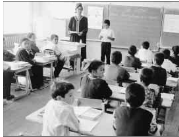
L'état civil permet de calculer, entre autres, le nombre d'enfants à scolariser. Une classe au Turkménistan, où 90 % des naissances sont enregistrées.

L'enregistrement à la naissance est le premier pas dans le chemin de la vie. Pour les enfants à qui l'on refuse un certificat de naissance, ce chemin sera plein de vicissitudes. Nous devons nous engager à garantir que tous les enfants du monde jouiront de ce précieux droit de naissance, qui est un bon de citoyenneté. Je ne peux imaginer de meilleure commémoration du cinquantième anniversaire de cette promesse solennelle faite à l'humanité, la Déclaration universelle des droits de l'homme . ■