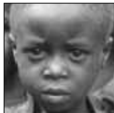
AFRIQUE AU SUD DU SAHARA

L'acte, ou certificat, de naissance est une preuve de l'identité de l'enfant, et la première reconnaissance de son importance pour le pays. Cette preuve de la naissance est exigée pour un certain nombre de services, et elle confère une certaine protection légale. Mais trop peu de pays en développement prennent au sérieux l'enregistrement des naissances, dont le taux varie considérablement d'un pays à l'autre, voire dans un même pays. Certains États ne savent même pas quelle proportion de leurs citoyens ont été enregistrés. Il est nécessaire que tous les pays en développement examinent leur situation, déterminent les progrès à réaliser et fassent le nécessaire pour y parvenir.