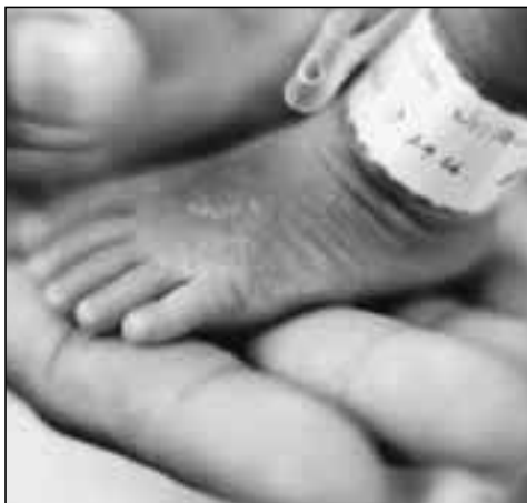
Normalement, les enfants nés à l'hôpital sont enregistrés avant le retour à la maison. C'est dans les pays où la proportion des naissances à domicile est la plus forte que les taux d'enregistrement sont les plus bas, pour des raisons logistiques.

Parfois, le système constitue en lui-même un obstacle. Ce droit fondamental est payant dans une cinquantaine de pays au moins, qui taxent