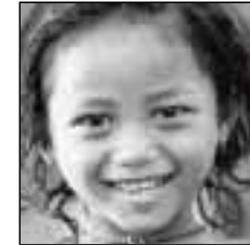
ASIE EST/SUD et PACIFIQUE

Remplacer la structure existante d'autorité exigera l'effort conjoint des femmes et des hommes.