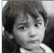
AFRIQUE DU NORD et MOYEN-ORIENT