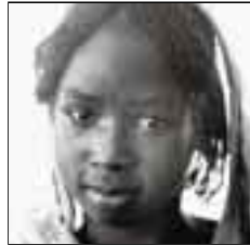
AFRIQUE AU SUD DU SAHARA