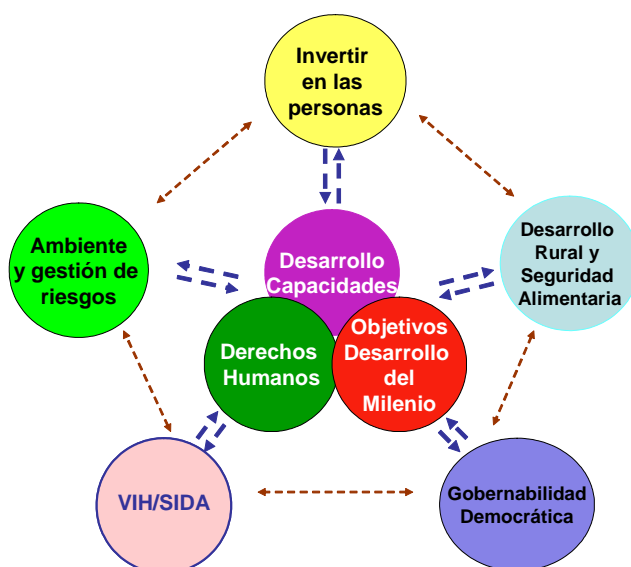
Ejes estratégicos de cooperación del SNU en Honduras - UNDAF 2007/2011